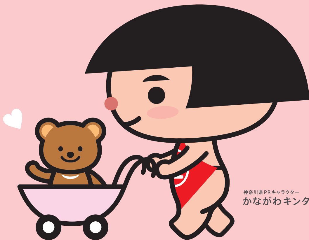
神奈川県PRキャラクター かながわキンタロウ